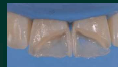
Restauration des parois proximales avec 3M™ Filtek™ Supreme XTE Universel, teinte A3E.