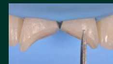
Dépose des restaurations et préparation du biseau avec une fraise diamantée.