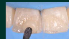
Application de la couche vestibulaire, A3 E, avec une épaisseur de 0,5 mm.