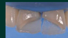
Couche d'émail en palatin après photopolymérisation.