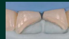
Tester la clé en silicone réalisée à partir d'un wax-up.