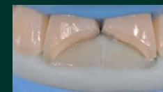
Une fois l'adhésif posé, la clé avec la couche d'émail palatine est positionnée.