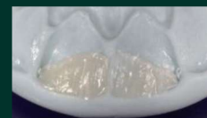
Restauration des murs palatins sur la clé avec 3M™ Filtek™ Supreme XTE Universel, teinte A3E.