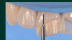
Mise en place de la teinte A2D. Création d'un espace de 0,5 mm pour la couche Émail.